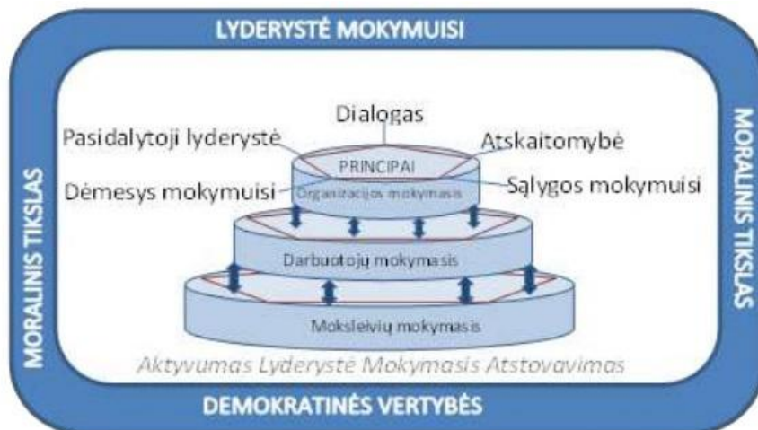
2 pav. Integruotas penkių principų lyderystės mokymuisi modelis

Mokykla mokymąsi konstruoja, atliepdama Besimokančios organizacijos sampratą. Tai yra atskleidžiama įgyvendinant Integruotą penkių principų lyderystės mokymuisi modelį , kuris papildytas bendru tikslu ir įsipareigojimų dedamąja. (žr. 2 pav.) pagal Swaffield ir MacBeatch (Valuckienė, Balčiūnas, Katiliūtė ir kt., 2015):